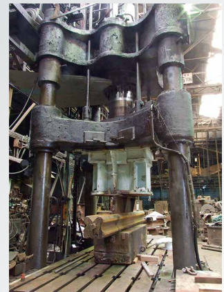
600トン4本柱プレス機