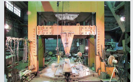
1500トンB門型プレス機