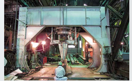
1500トンA門型プレス機